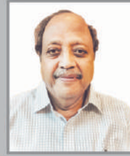
ಶ್ರೀ ಮಲ್ಲಕಾಬುಗನ ಕಣವಿ ವಕೀಲರು