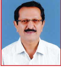
ಅಂದನೂರು ಮುಪ್ಪಣ್ಣ ನಿರ್ದೇಶಕರು