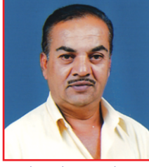
ಮತ್ತಿಹಳ್ಳಿ ವೀರಣ್ಣ ನಿರ್ದೇಶಕರು