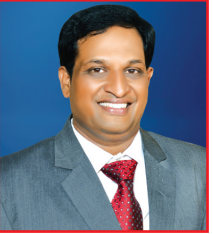
ಮಂಡಾಸ ವೀರೇಂದ್ರ ಚಾರ್ಟರ್ಡ್ ಅಕೌಂಟೆಂಟ್ಸ್ ವೃತ್ತಿಪರ ನಿರ್ದೇಶಕರು